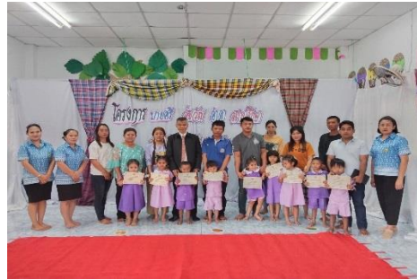
ภาพการส่งเสริมการใช้ถุงผ้า กระเป๋าผ้า กระเป๋าจาก วัสดุธรรมชาติ ภายใต้สโลแกน “คน ทัพบกรัก สุขภาพ รักสิ่งแวดล้อม

การรณรงค์ ลด ละ เลิก ใช้พลาสติก ส่งเสริมการใช้ผ้า วัสดุจากธรรมชาติ ภายใต้สโลแกน “คน ทัพบกรักสุขภาพ รัก สิ่งแวดล้อม”